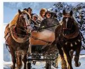
Bayern, Freyung Sammerhof