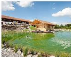
Bayern, Seon Staller Ferienhof