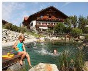
Bayern, Böbing Bussjägerhof