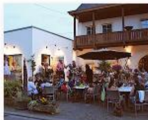
Rheinland-Pfalz, Langsur Johannishof