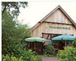
Nordrhein-Westfalen, Gronau Familotel Ferienhof Laurenz