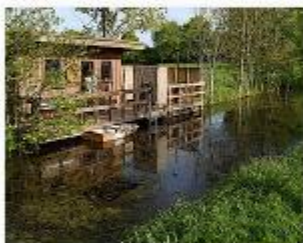
Schleswig-Holstein, Aukrug Ferienhof Ratjen