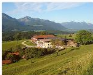
Bayern, Siegsdorf Ferienparadies Daxlberger Hof