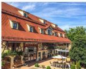
Schleswig-Holstein, Bad Saulgau Dreher's Erlebnishof