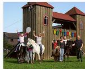
Schleswig-Holstein, Schwienkuhl Ferienhof Lunau