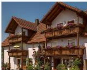
Bayern, Thanstein Simmernhof